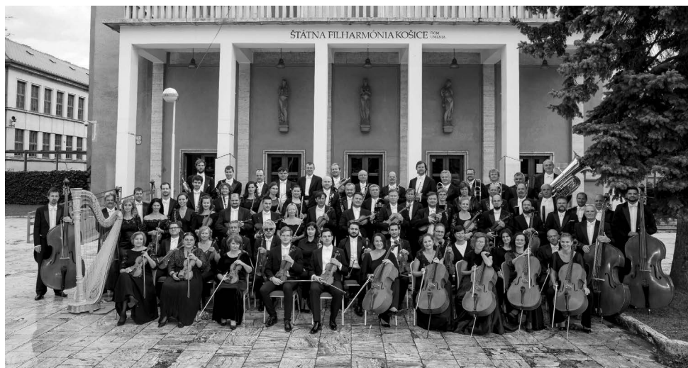
Štátna filharmónia Košice

Štátna filharmónia Košice (ŠfK) oslavuje v tejto sezóne 50 rokov od svojho založenia. Prvý koncert novovzniknutého telesa sa uskutočnil v apríli 1969 pod vedením vtedajšieho šéfdirigenta Bystríka Režuchu. Filharmónia dosiahla v krátkom čase uznanie odborníkov i verejnosti a stala sa jedným z popredných reprezentantov slovenského interpretačného umenia doma i v zahraničí. ŠfK koncertovala na významných medzinárodných hudobných festivaloch a v dôležitých kultúrnych centrách (Viedeň, Salzburg, Berlín, Budapešť, Praha, Antverpy, Lisabon, Barcelona, Atény, Remeš, Hong-Kong, Luxemburg, New