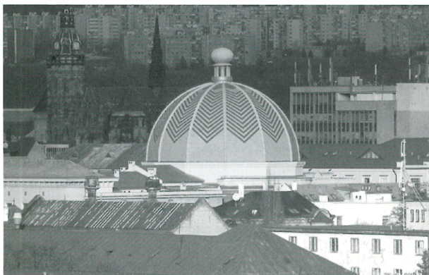
kupola Domu umenia