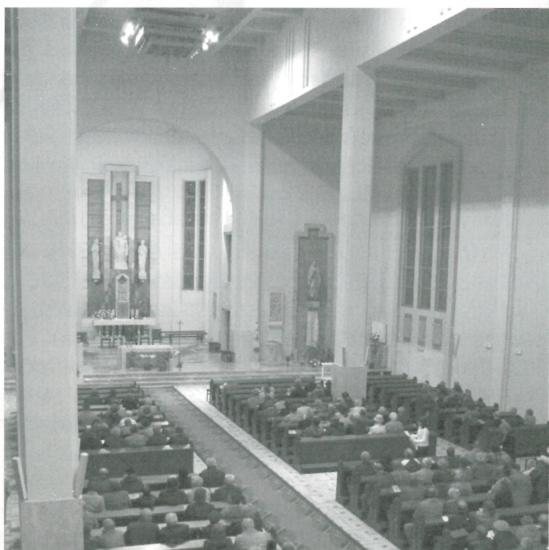
Interiér Konkatedrály Sedemb. Panny Márie

i v Taliansku, Portugalsku, Nemecku, Francúzku. Bol hosťom viacerých medzinárodných organových festivalov na Slovensku a v zahraničí. Realizoval niekoľko koncertných nahrávok pre Slovenský rozhlas. Od roku 2005 je pedagógom organovej hry na Konzervatóriu J. L. Bellu v Banskej Bystrici a organistom v katedrálnom chráme sv. Františka Xaverského. Je spoluorganizátorom a dramaturgom medzinárodného organového festivalu Organfest Banská Bystrica. Pravidelne zasadá do porôt organových súťaží na Slovensku a v Českej republike. Pôsobí taktiež ako poradca pri opravách a rekonštrukciách organov v banskobystrickej diecéze.