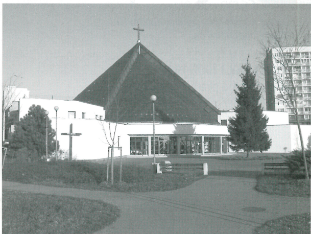
Kostol sv. košických mučeníkov