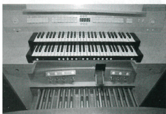
Kostol sv. A. Paduánskeho