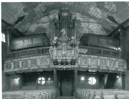
Organ v Drevenom artikul. kostole v Kežmarku Národná kultúrna pamiatka